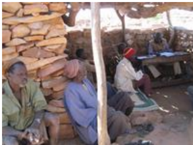
3 - Le Chef du village et son Conseil donnent leur accord sur le Projet - Le 22.02.2015