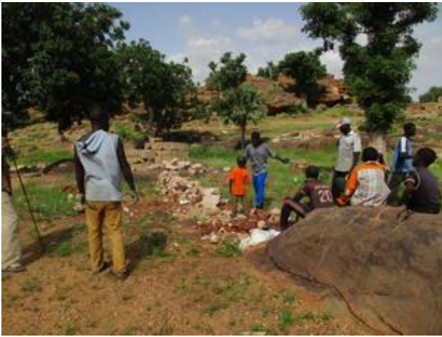
19 - Implantation des latrines - Le 20.09.2016