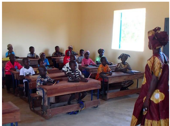
26 - Classe - Le 17.10.2016