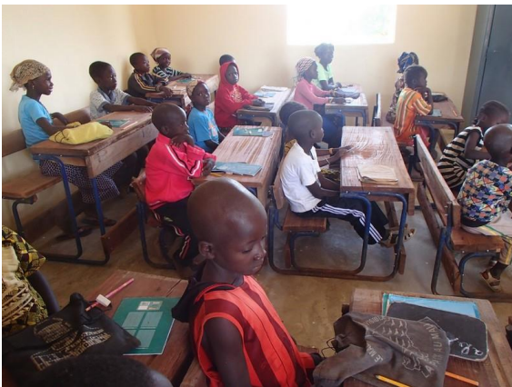
23 - Classe - Le 17.10.2016