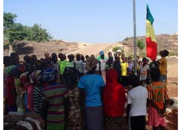
22 - Lever des couleurs - Le 17.10.2016