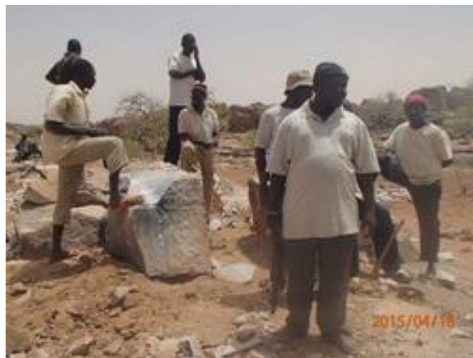
4 - Casse, transport des pierres par les villageois

Et nous pouvons affirmer sans crainte que tous les Euros destinés à ce Projet sont arrivés à destination sans aucun détournement de "piste" ! Saluons aussi pour cela la vigilance et la probité de notre représentant sur place !