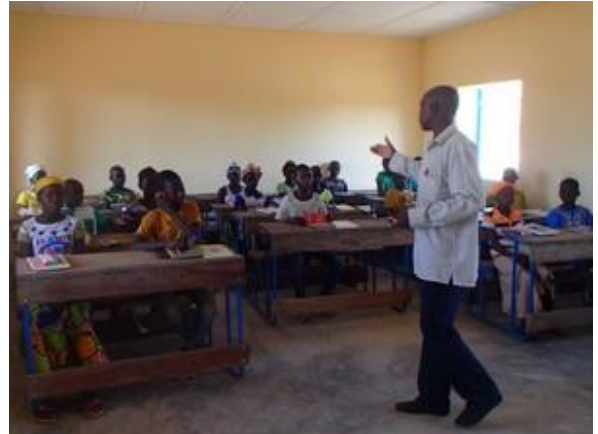
24 - Classe - Le 17.10.2016