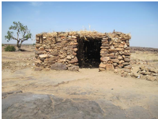
1 - L'ancienne classe des plus jeunes en 2014 !

Il restera maintenant à veiller au bon achèvement du Projet, surveiller les moindres petites erreurs à corriger et surtout prendre en charge, en juin 2017, le renouvellement du petit matériel (cahiers,...) ainsi que les livres