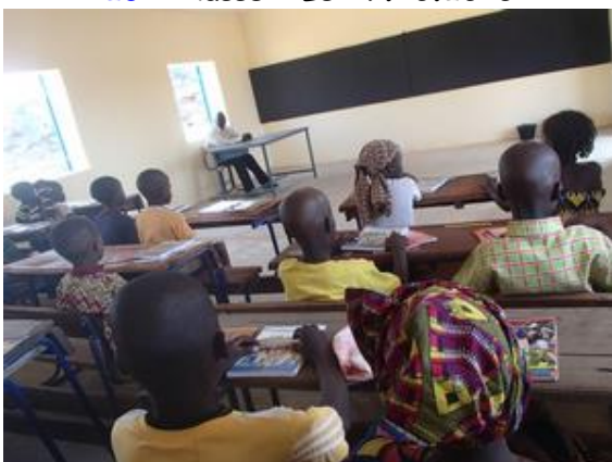
25 - Classe - Le 17.10.2016